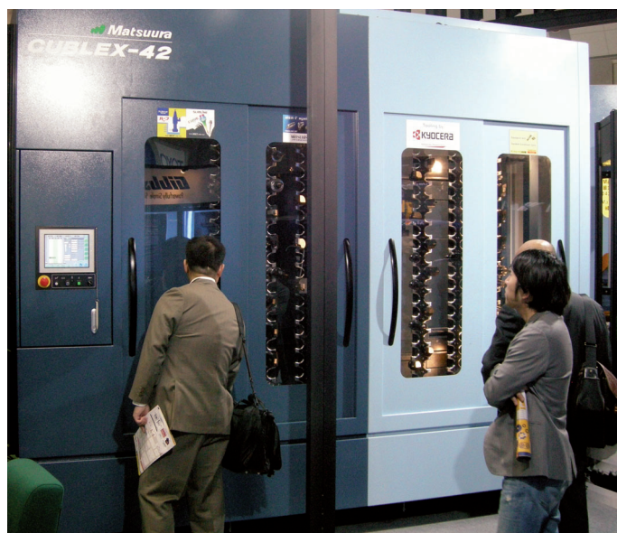
MATSUURA OLII JIMTOFF 2008 -MESSUILLA JAPANISSA ESILLÄ LAAJALLA ARSENAALILLA. NÄYTTÄVÄLLÄ OSASTOLLA SUURTA MIELENKIINTOA HERÄTTI MUUN MUASSA CUBLEX-42.

Tällä hetkellä Matsuura valmistaa työstökeskuksia kaikkien teollisuudenalojen tarpeisiin. Va-