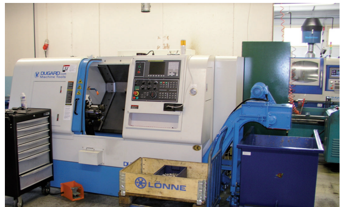
VINOJOHTEINEN DUGARD EAGLE 200 HT SAATIIN AIKATALUN MUKAISESTI TUOTANTOON TÄMÄN VUODEN TOUKOKUUSSA.

– Näiden kolmen vuoden aikana ei ole koneissa esiintynyt ensimmäistäkään vikaa. Kun tähän vielä lisää, että koneet ovat osoittautuneet erittäin toistotarkoiksi ja koneiden toimitus-