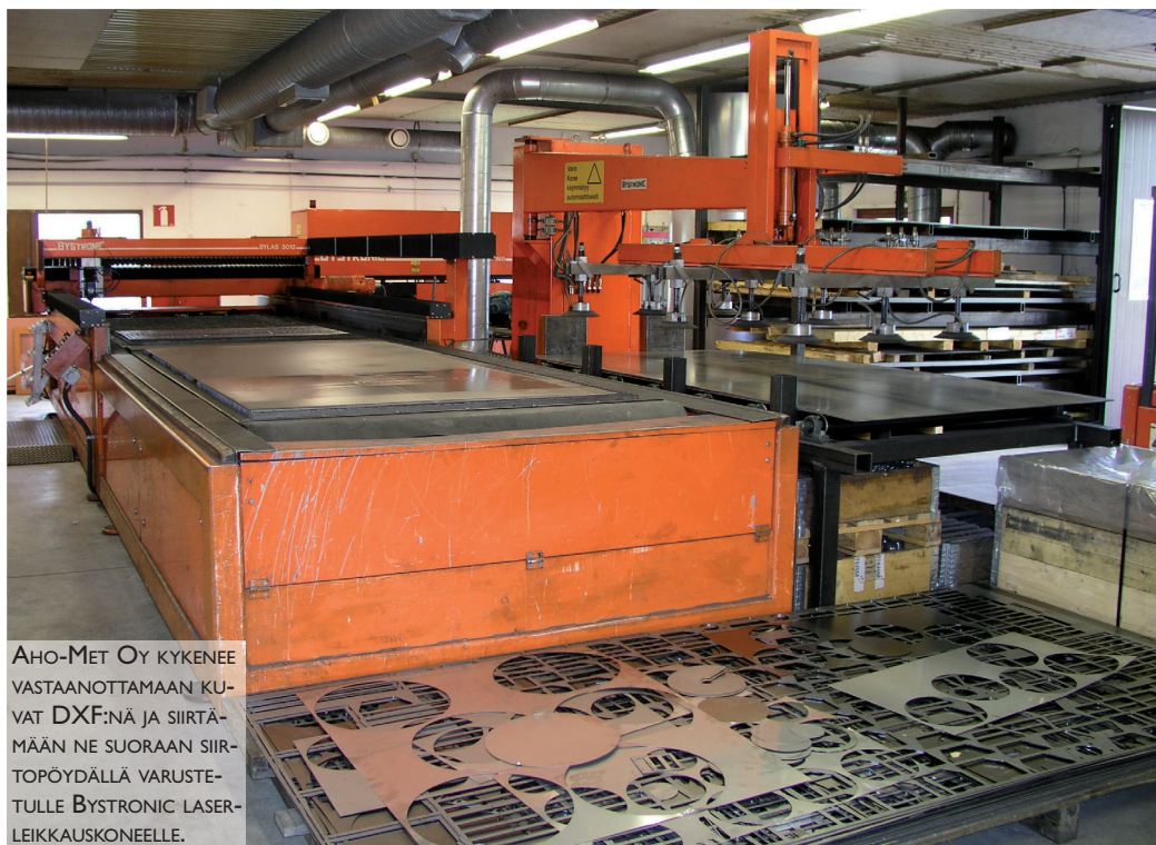
AHO-MET OY KYKENE VASTAANOTTAMAAN KUVAT DXF:NÄ JA SIIRTÄMÄÄN NE SUORAAN SIIRTOPÖYDÄLLÄ VARUSTETULLE BYSTRONIC LASERLEIKKAUSKONEELLE.

Seuraava kohde oli CNC-työstökeskuksen hankinta. Hyvien Dugard Eagle kokemusten innoittama myös vuonna 2008 hankittu uusi työstökeskus edustaa samaa merkkiä. Dugard Eagle 1300 työstökeskuksessa on 24 paikkainen työkalumakasiini. X-liike on mallimerkinnän mukaisesti 1300 mm, y=635 mm ja z = 635 mm.